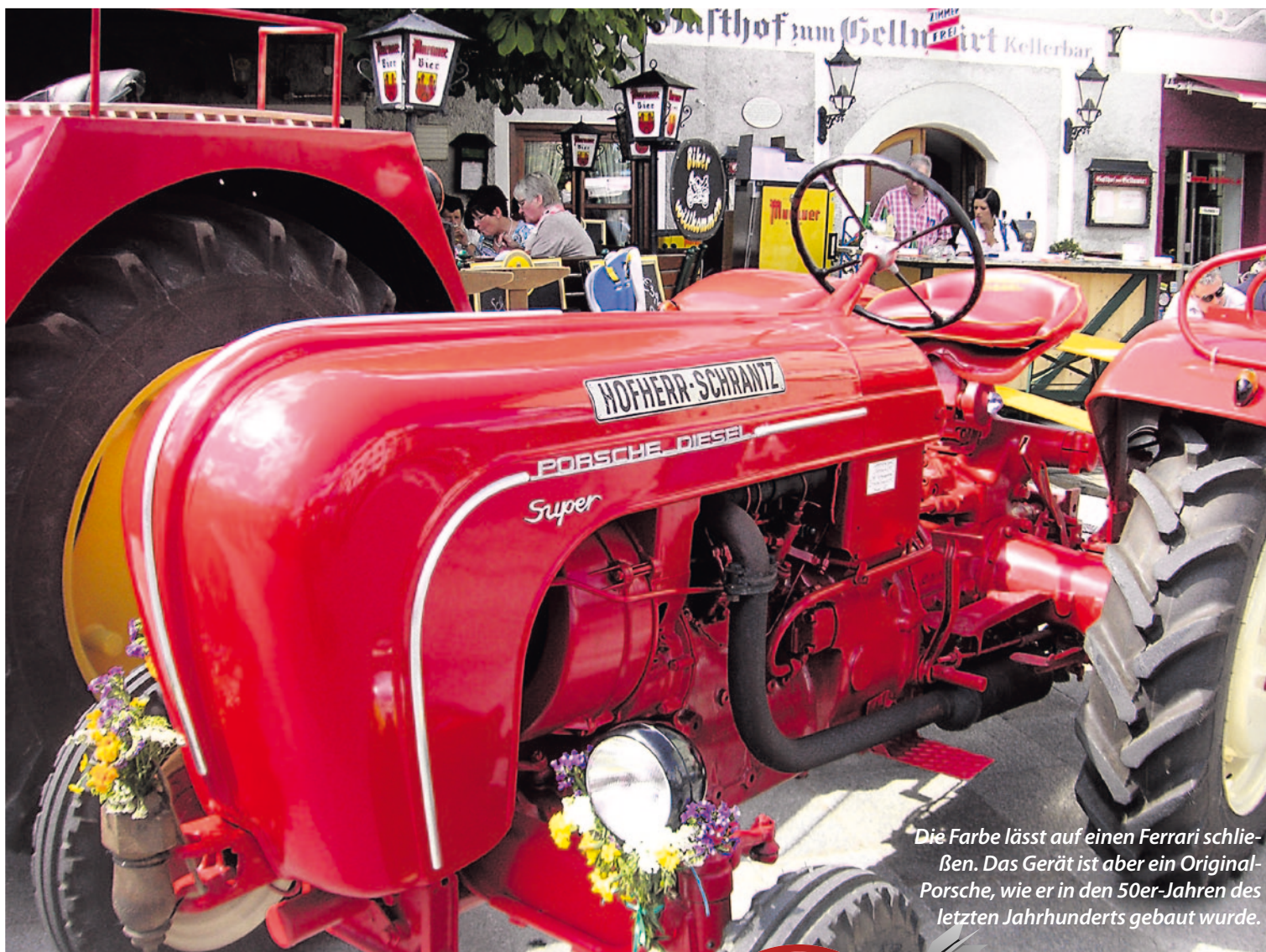
Die Farbe lässt auf einen Ferrari schließen. Das Gerät ist aber ein Original-Porsche, wie er in den 50er-Jahren des letzten Jahrhunderts gebaut wurde.