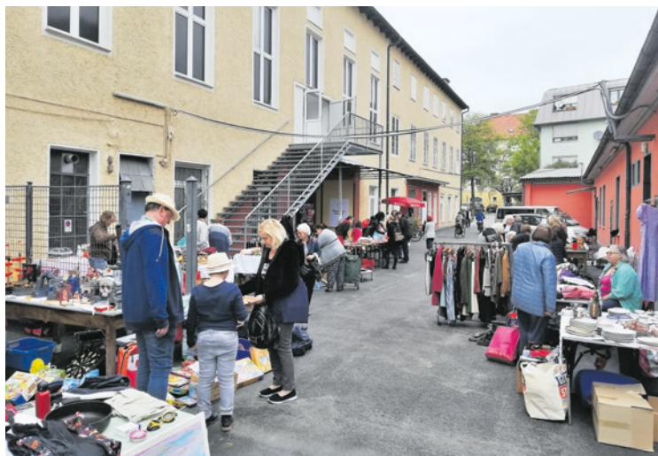
Der Flohmarkt am Volkshausgelände im Mai war ein Erfolg. Nächster Termin: Sa., 28. September, 10 - 15 Uhr. Anmeldungen: 0316/ 71 24 79.

Mittwoch, 19. Juni 2019, 19 Uhr Volkshaus Graz, KPÖ Bildungsverein