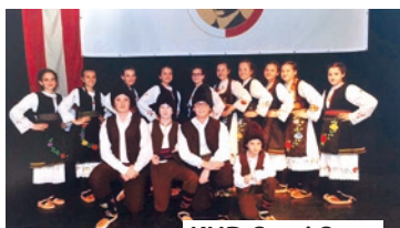
KUD Sveti Sava

Für die musikalischen Höhepunkte sorgen die Rocklegende Zabranjeno pušenje aus Sarajevo (Garagen-Rock mit Folklore-Einflüssen), das Sandala Orkestar aus Graz (Yugo Klassiker im gemischten Satz aus Österreich und dem Balkan), die Formation Tamburaši Kavkler (die kleine Tambura mit dem großen Klang), das Kult Duo (Akkordeon-Kolos zum Mittanzen) und natürlich die Tanzgruppe KUD Sveti Sava. DJ Crna Trava sorgt für die notwendige Hintergrundstimmung vor Sonnenuntergang, bis tief in die Nacht wird gefeiert mit BJ Nevenko. Durch das Programm