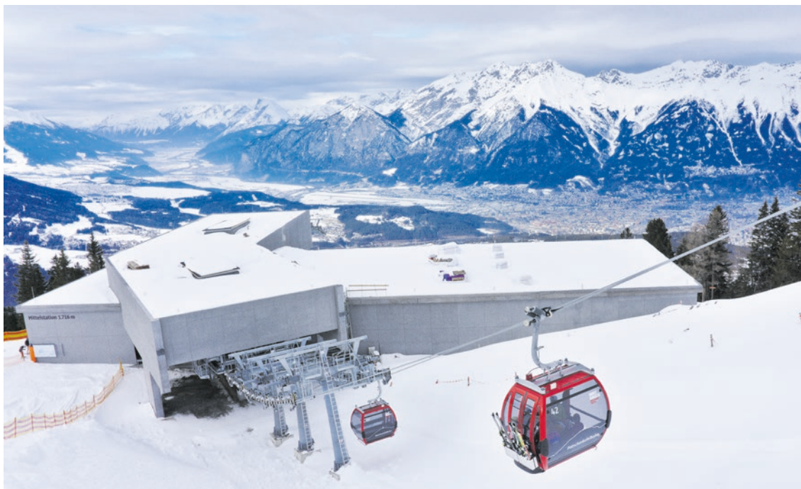
Patscherkofelbahn: Hände weg von hochfliegenden Prestigeprojekten! – Das könnte die Stadt Graz aus diesem Debakel lernen.

Man kann sich unter diesen Vorzeichen leicht ausmalen, wie teuer die Stadt Graz das Olympia-Abenteuer gekommen wäre.