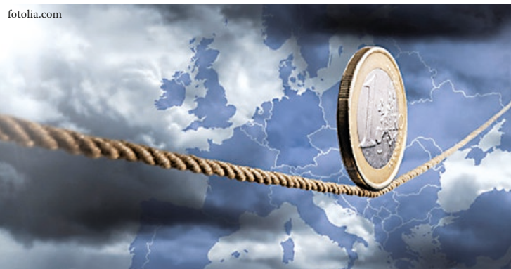
Das Versagen der EU bereitet den Menschen Kopfzerbrechen.

Mit anderen Worten: das Europäische Parlament will eine weitere Möglichkeit für Konzernlobbying schaffen! Kein Wunder: In Brüssel gehen die Vertreter der Großkonzerne ein und aus. Sie setzen dort ihre Interessen durch. Der Widerstand muss deshalb von unten kommen. Das ist eine wichtige Lehre aus dieser Auseinandersetzung.