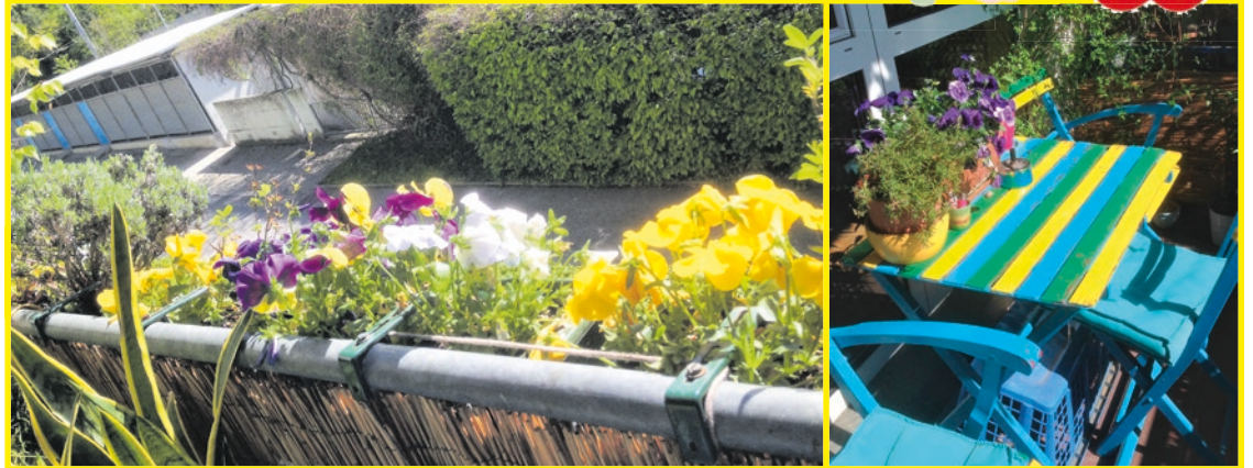
Eine blumige Idylle, die zum Verweilen einlädt. Unter den ersten Einsendungen war auch dieser wunderschön gestaltete Balkon von Edith S. dabei. Einfach anmelden, mitmachen und Graz bunter machen!

Elke Kahr will mit Ihnen gemeinsam Graz bunter machen! Egal ob Balkon, Fensterbankerl oder (Vor)Garten. Alle sind herzlich eingeladen, beim Blumenschmuckwettbewerb der Grazer KPÖ mit zumachen.