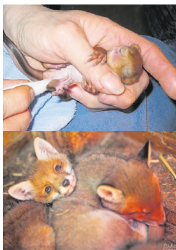
Eichörnchenbaby und Fuchsba- bies.

Auf der Homepage des Vereins wurde angekündigt, dass ab 01.06.2019 keine Tiere mehr aufgenommen werden können, auch Personal muss reduziert werden. Der Verlust dieses wichtigen Vereins wäre ein großer Verlust für die Stadt Graz, denn der Einsatz für unsere Natur und Tierwelt sollte nicht als selbstverständlich angesehen werden.