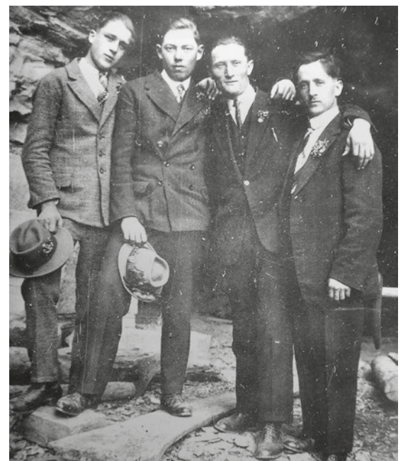
Bergleute vor dem Sunfixl-Steinbruch, 1932.