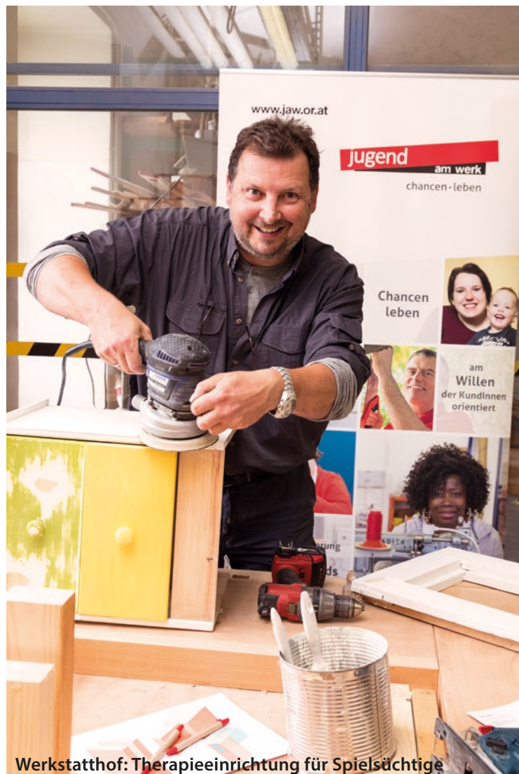
Werkstatthof: Therapieeinrichtung für Spielsüchtige

Graz, Kärntnerstraße 25/1. Freitag bis Sonntag und an Feiertagen: 14-20 Uhr Projektleiter Gerald Pfeiffer: 0664/800 062 218