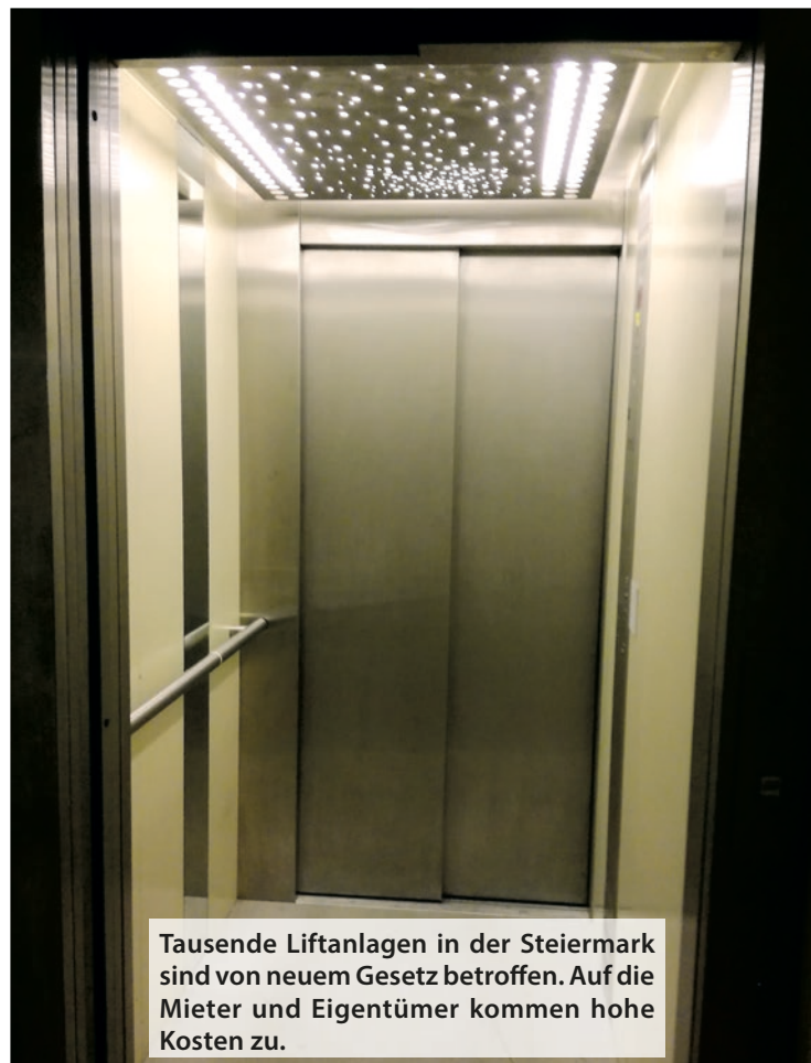
Tausende Liftanlagen in der Steiermark sind von neuem Gesetz betroffen. Auf die Mieter und Eigentümer kommen hohe Kosten zu.