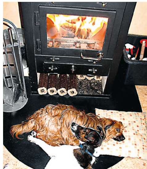
Die KPÖ setzt sich für die Erhöhung des Heizkostenzuschusses ein.

Sport- und Bildungseinrichtungen berechtigen, eine ermäßigte Benützung öffentlicher Verkehrsmittel ermöglichen und zur unbürokratische Inanspruchnahme von Zuschüssen, Beihilfen und staatlicher Transferleistungen berechtigen.