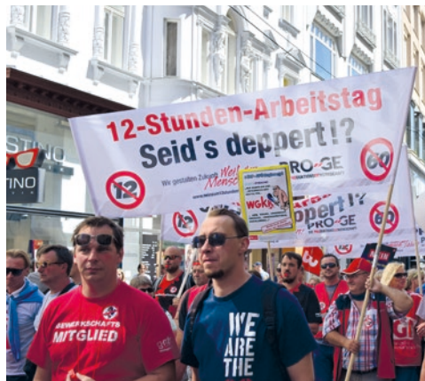
Demonstration gegen den 12-Stunden-Tag in Wien: Über Hunderttausend arbeitende Menschen aus ganz Österreich kamen.

Friedrich Engels, Zur Lage der arbeitenden Klasse