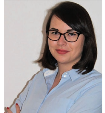
Von Nadža Kulo Aus der Zeitung der KPÖ Kapfenberg

Eine richtige Klimaanlage hat der Golf II nicht. Wozu auch, die altbewährte „tošiba“-Methode reicht bei den rund 40°C Hochsommertemperaturen in Zentralbosnien vollkommen aus. „Tošiba“ bezeichnet im Prinzip nur ein offenes Fenster. Die richtige Handhabung der „tošiba“ sei jedoch gekonnt. Man muss nämlich beachten, dass man für eine angenehme Körperkühlung den Ellenbogen aus dem Fenster hängen lassen muss. Wenn man Raucher ist, und in Bosnien ist nahezu jeder Mensch Raucher, hat es auch den Vorteil, dass man die Zigarette aus dem Fenster halten kann und der Windzug gleichzeitig die Asche entfernt. So kann man den im Auto integrierten Aschenbecher