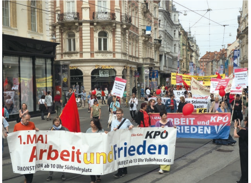
Beim Maiaufmarsch der steirischen KPÖ war der 12-Stunden-Tag das bestimmende Thema. Mehr Arbeit, weniger Geld, weniger Erholung, weniger Zeit für die Familie: Die Gesellschaft entwickelt sich in eine beunruhigende Richtung.

KPÖ-Klubobfrau Claudia Klimt-Weithaler sagte nach der Abstimmung: „Die SPÖ inszeniert sich mit einer teuren Werbekampagne als Gegenpol zur schwarz-blauen Bundesregierung. Sie traut sich aber nicht einmal, im Landtag für ihre eigenen Forderungen einzutreten. Das Abstimmungsverhalten der SPÖ am Dienstag war eine politische Kapitulationserklärung der steirischen SPÖ.“