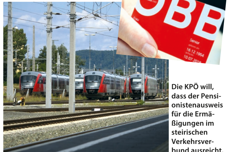
Die KPÖ will, dass der Pensionistenausweis für die Ermäßigungen im steirischen Verkehrsverbund ausreicht.

Die Details der Partnerschaft mit der deutschen Fintech, die sich selbst als „moderne Smart Bank“ bezeichnet, sind noch nicht bekannt. Bisherige Erfahrungen mit sogenannten smarten Banken sehen jedoch alles andere als kundenfreundlich aus: Auf ein Minimum reduzierte Filialnetze, in denen die Kunden an Automaten selbst die Arbeit der Bankbediensteten erledigen.