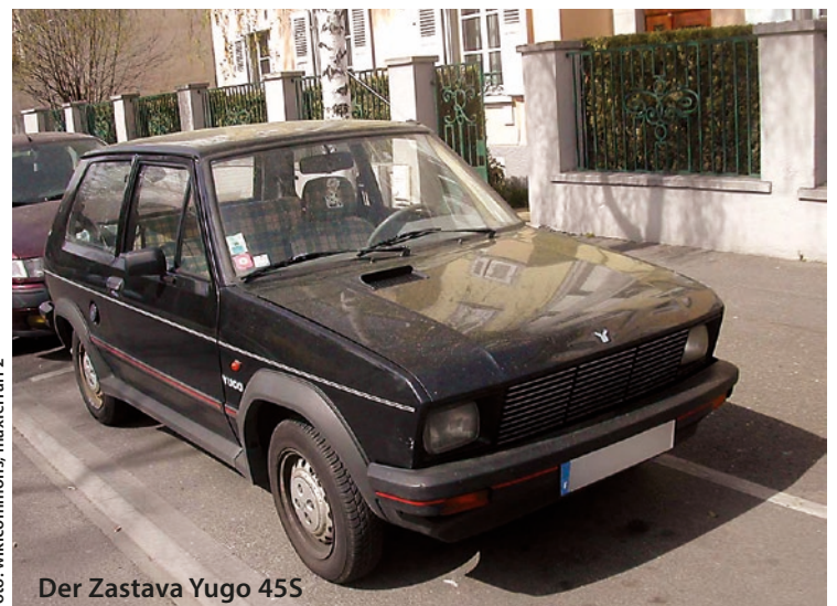
Der Zastava Yugo 455

Ich bin Raucherin und mein Renault Clio hat einen defekten Klimakompressor, doch ich habe es bis heute noch nie übers Herz gebracht, die „tošiba“-Methode zu perfektionieren. Aus welchem Grund auch immer.