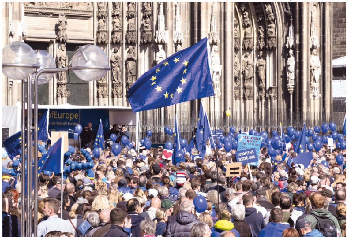
Europa-Fanatismus birgt die gleichen Gefahren in sich wie jeder andere Nationalismus.

Wie ist das nun mit der EU? Sie wird in der aktuellen Propaganda als Alternative zum Nationalismus in einigen ihrer Mitgliedsstaaten wie Ungarn, Polen oder Italien dargestellt. In der EU würde dieser Nationalismus durch die „europäischen Werte“ überwunden. Genau diese Behauptung führt uns aber auf die Spur des EU-Nationalismus. Zum Nationalismus gehört nämlich immer das Gefühl, dass man selbst etwas Besseres wäre als die anderen. Die „glühenden Europäer“ – dieser seltsame Begriff ist mittlerweile gang und gäbe geworden – grenzen sich mit dieser Behauptung von den „anderen“ ab, die als minderwertig wahrge-