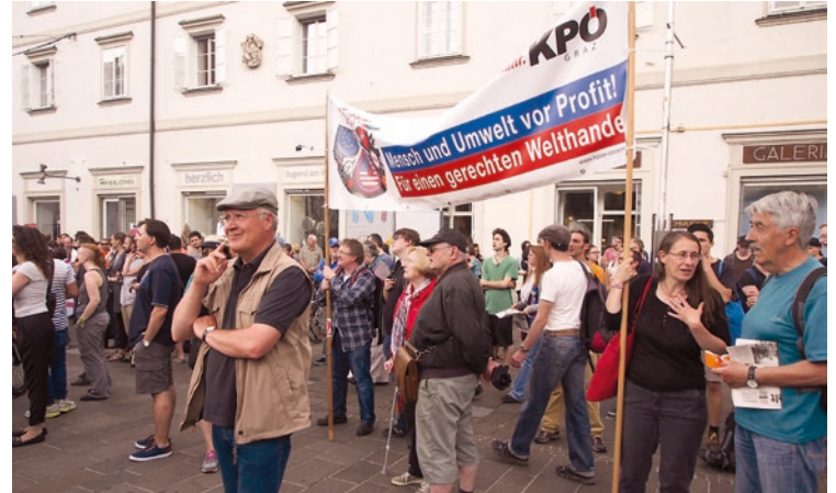
In ganz Österreich protestierten Tausende gegen den Beitritt zum transatlantischen Freihandelsabkommen. Die FPÖ brach ihr Wahlversprechen und gab grünes Licht für den Beitritt.

sich in Umfragen gegen das Abkommen ausgesprochen. Fast 600.000 haben Anfang 2017 das Volksbegehren gegen CETA, TTIP und TiSA unterschrieben. CETA ermöglicht Konzernen Sonderklagsrechte gegenüber dem Staat, wenn sie sich durch Sozial- oder Umweltgesetze in ihren Profiten geschmälert sehen. Das ist ein massiver Eingriff in die österreichische Verfassung.