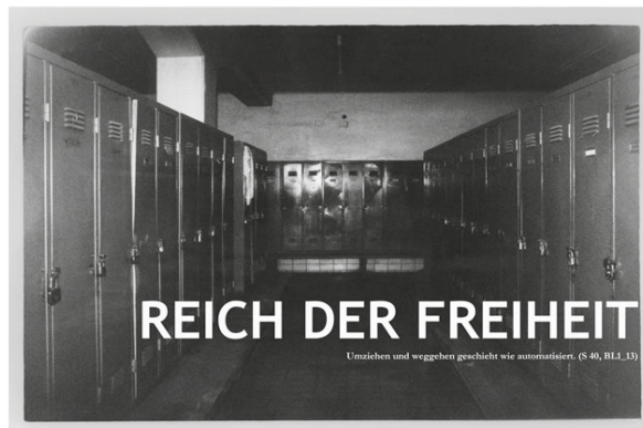
Unziehen und weggehen geschieht wie automatisiert. (S 40, BIL. 13)