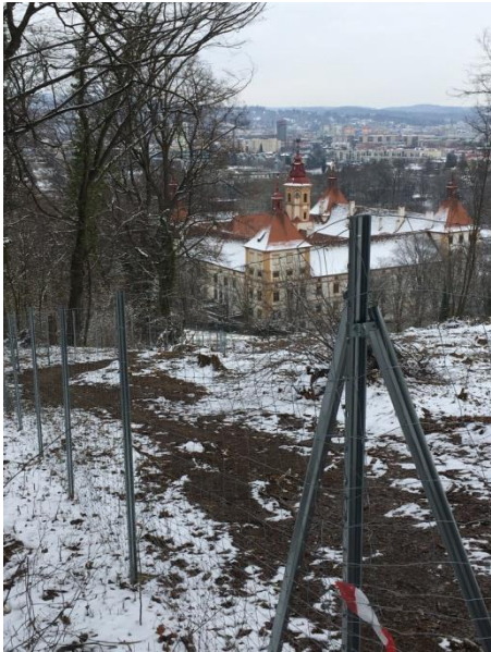
bzw. endet endgültig durch neu errichteten Zaun