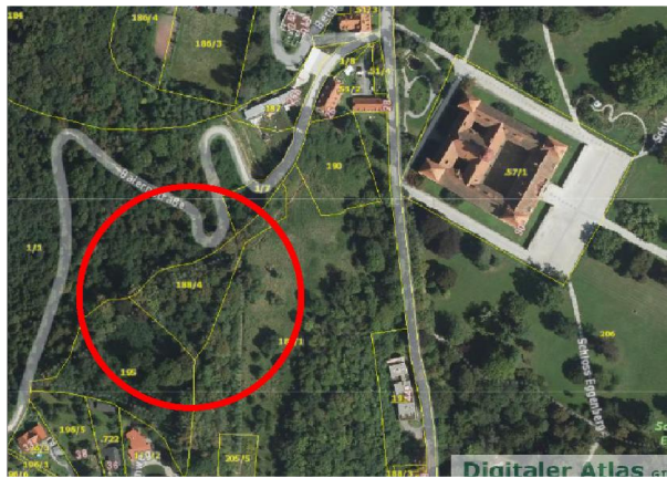
Auszug aus GIS Steiermark