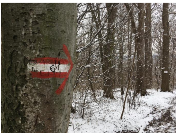
...endet der Wanderweg Nr. 6 mit dem Hinweis