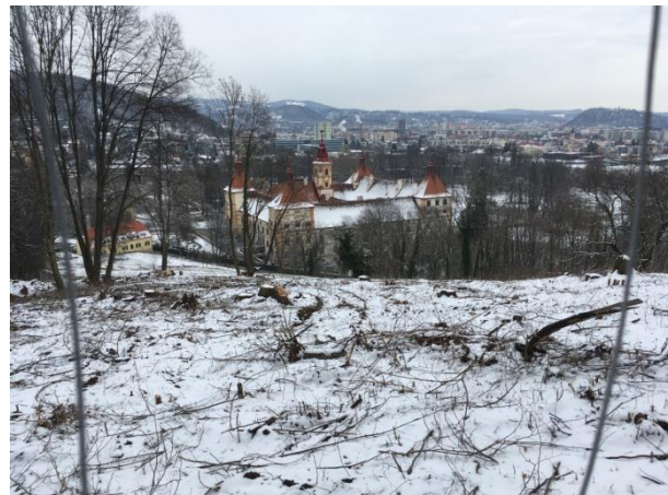
...wurde endgültig vernichtet

Wie es dazu kommen kann, dass Wald für die zukünftige Generation vernichtet werden darf, beschäftigt viele Grazer Eggenberger.