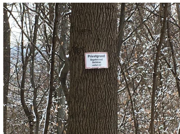
"Privatgrund Begehen und Befahren verboten"