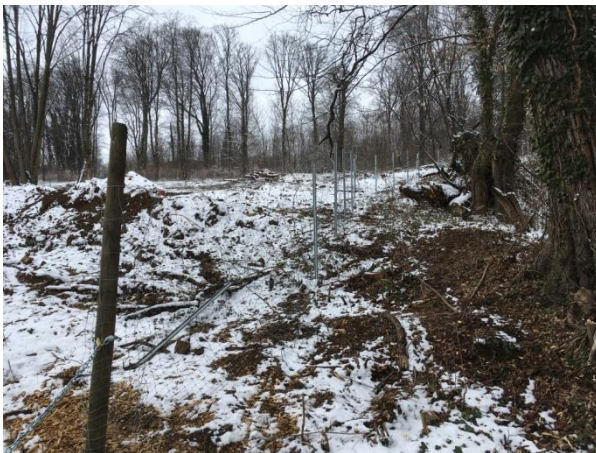
Widmung LF mit Zusatz "Wald"