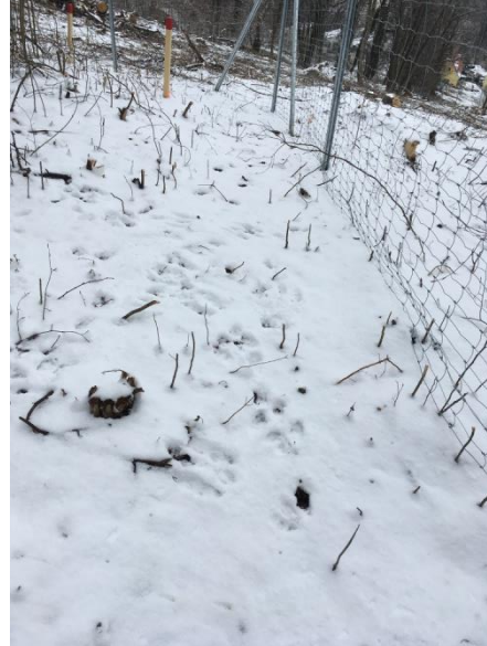
Wildtiere stehen nun vor einem unüberwindbaren Hindernis..