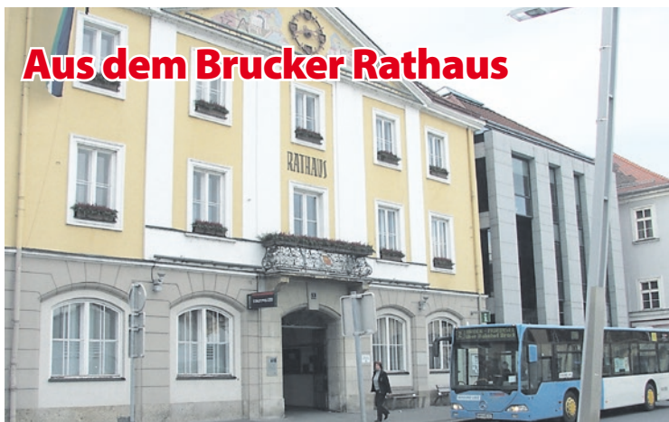
Aus dem Brucker Rathaus